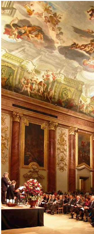
Konzert im Herkulesaal