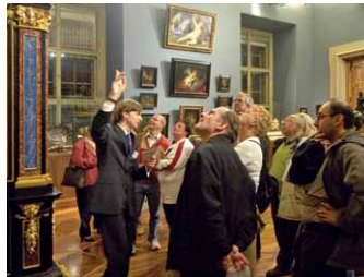
Führung im LIECHTENSTEIN MUSEUM