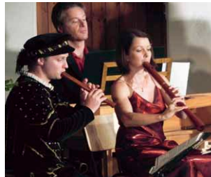
Paul Hofhaimer Consort