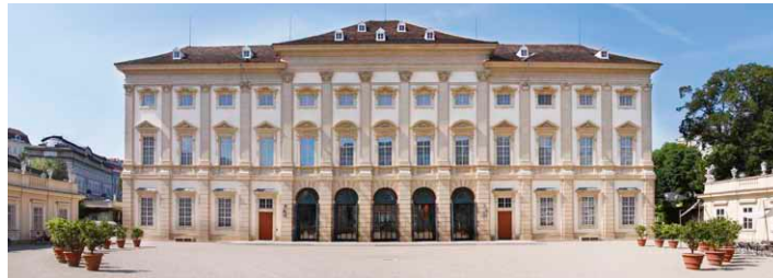
Die Südfassade des Gartenpalais Liechtenstein