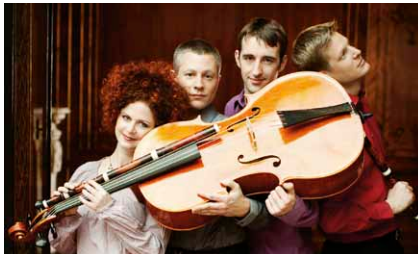
musica novantica vienna